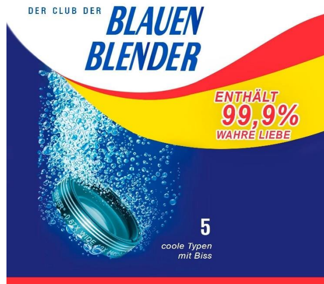
Foto- und Filmreise mit dem Club der blauen Blender

Herzlich Willkommen zu unseren Messeangeboten